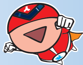
滋賀県人権啓発キャラクター「ジンケンダー」