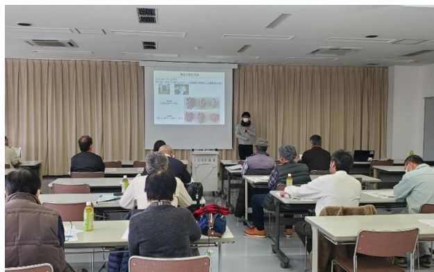
なし・ぶどうスタート研修会の様子