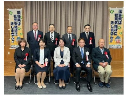
令和4年「なくそう犯罪」滋賀安全なまちづくり大会表彰式 令和4年10月8日（土） ひこね市文化プラザ

ひこね市文化プラザ（彦根市）において開催し、防犯功労者（団体）に対する各種表彰を実施（10月8日）