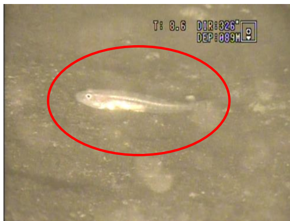
図2 第一湖盆で確認したイサザ