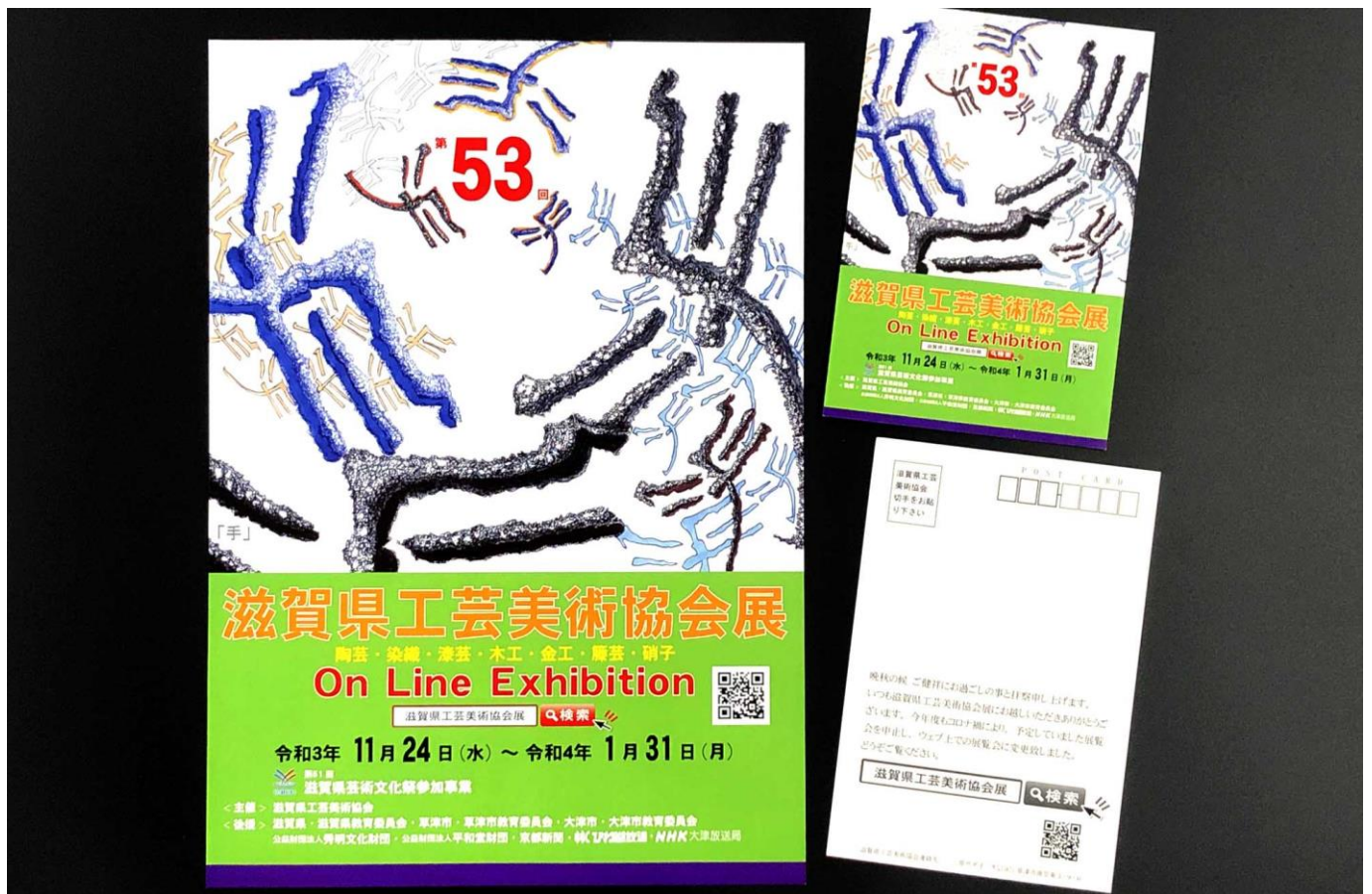
チラシ 3000 枚、DM2000 枚を配布。手がテーマのデザイン