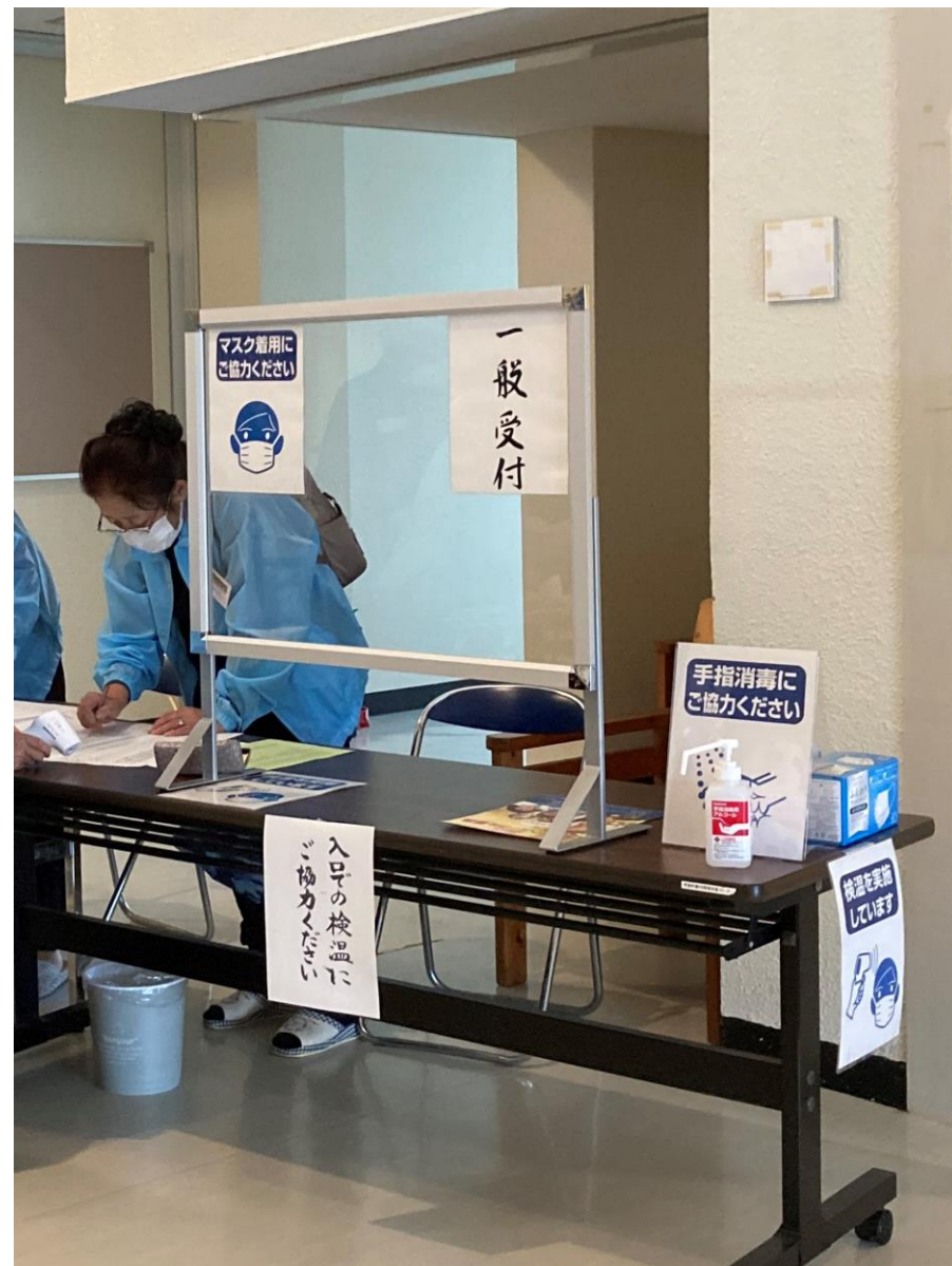
受付は背の高いアクリルパーテーション