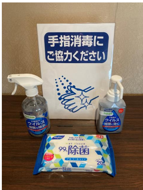
消毒薬はあらゆる場所に設置