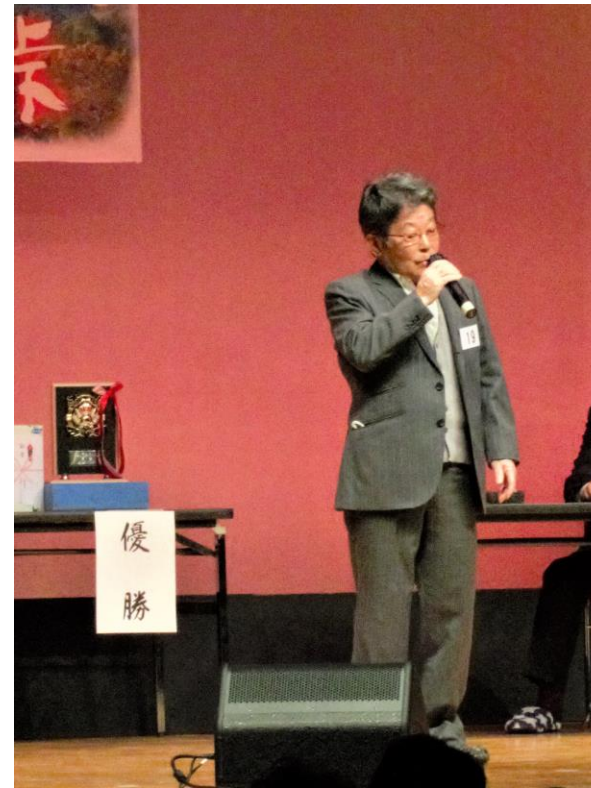
優勝を目指して熱演