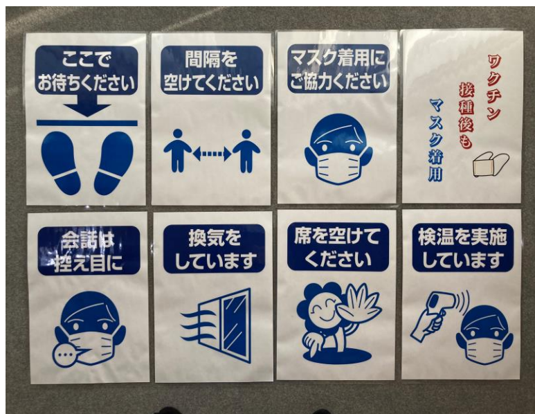
ロビーとホールの掲示ポスター