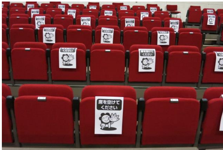
ソーシャルデスタンス