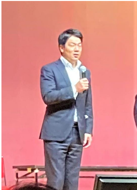
岩永甲賀市長ごあいさつ