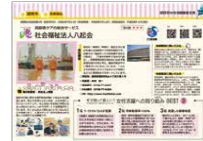
▲滋賀県女性活躍推進企業の取組事例