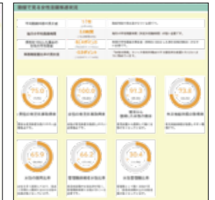
▲数値で見る女性活躍推進状況