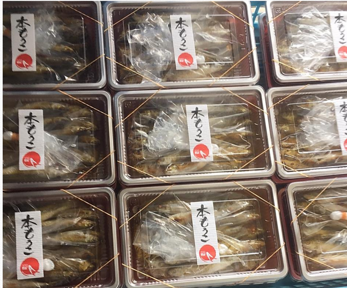
ほんもろこ 酢漬け