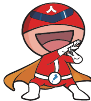
滋賀県人権啓発キャラクター ジンケンダー