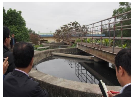
現地処理施設の視察