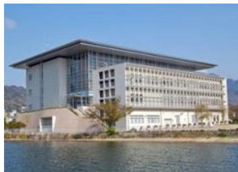
琵琶湖環境科学研究センター