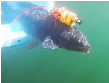
カメラを取り付けたコイによる調査

写真（左）はコイにカメラを取り付けて琵琶湖に放流している場面で、得られた映像からコイの生活や生息環境を調査しています。写真（右）は、コイ・フナ類の生息調査の様子を紹介した公開動画です。