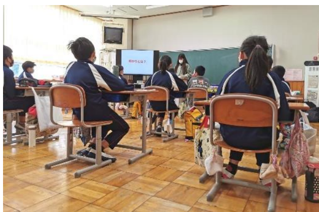
米の収穫、乾燥、調製の工程を説明