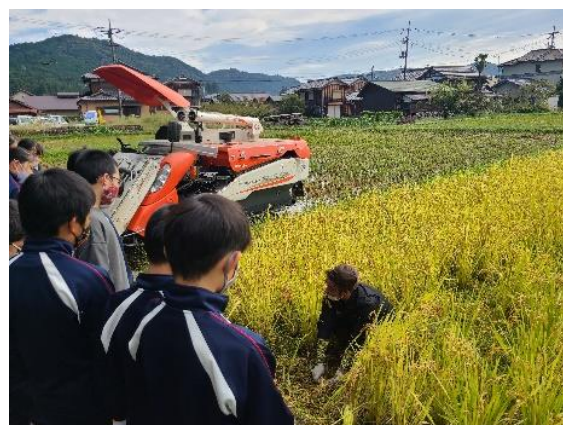
鎌を用いた収穫方法を説明