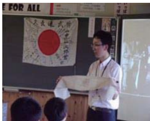
出前授業での様子 (船岡中学校)