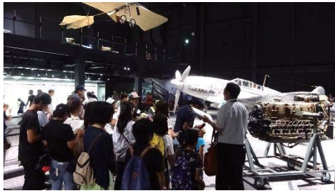
岐阜かかみがはら航空宇宙博物館の見学