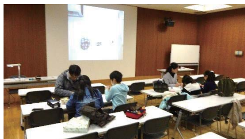
お手玉作りの様子