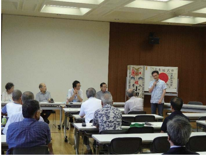
ボランティア全員集会