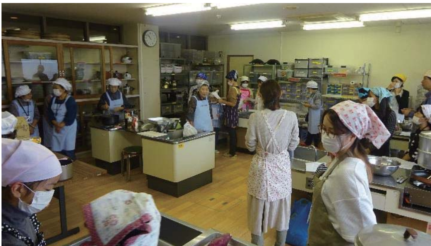
平和の学校あかりでの戦時食紹介活動