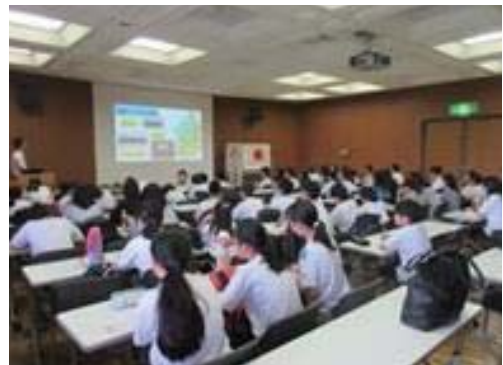
来館学習での様子(愛知中学校)