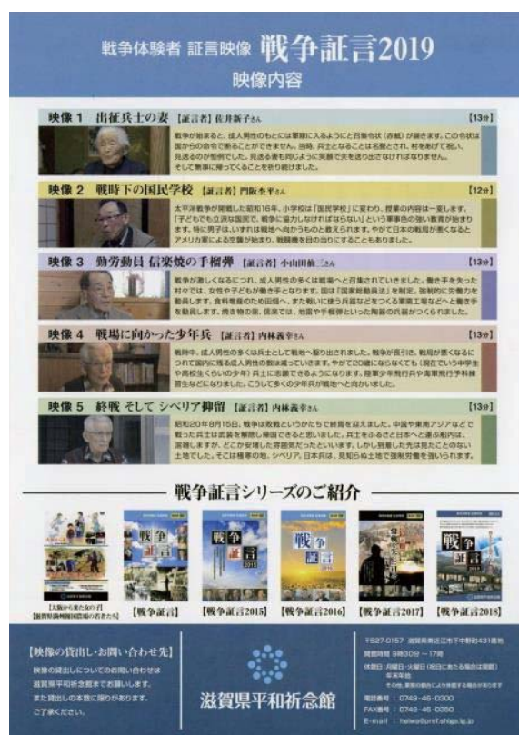
戦争体験者証言映像『戦争証言2019』チラシ