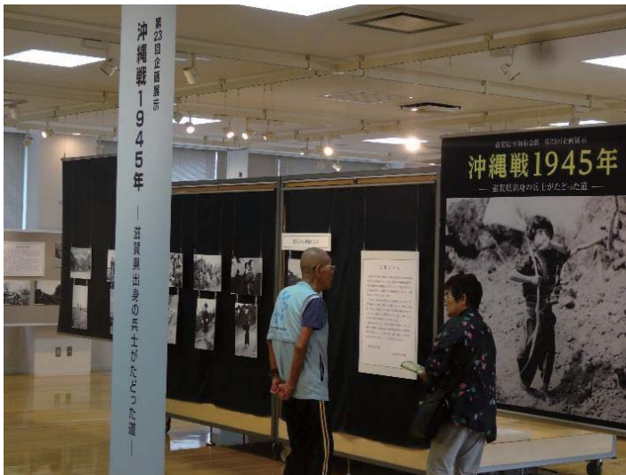
来館者への案内活動