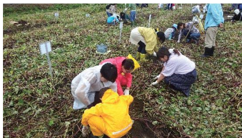
サツマイモの収穫

あいとうマーガレットステーション隣接農園でサツマイモの収穫をした後、そのサツマイモで戦時食を作る調理、試食体験を実施した。