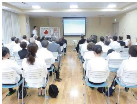
出前講演での様子 (島学区平和祈念式典)