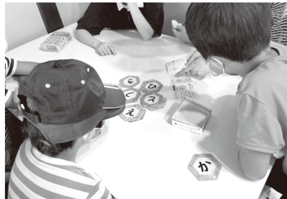
第三の居場所でカードゲームをしている様子

「若者の居場所「誰にも会いたくないカフェ」、誰でも来れる地域の居場所「地域循環型未来食堂みんなの食堂」、子どもの居場所「子ども第三の居場所」など、居場所事業を中心に運営しています。子ども食堂やおすそ分けDAYなど様々な体験メニューを実施。当日参加可能です。ぜひお越しください。