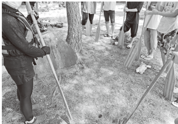
夏に行われたヤングケアラーのキャンプにて琵琶湖のアクティビティの様子

こどもソーシャルワークセンターでは、若者ケアラーの力を借りて、ヤングケアラーが子どもらしい時間を過ごせる居場所づくりやつながりの場づくり(オンラインサロン)を毎週行っています。