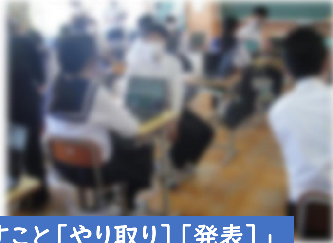
「話すこと[やり取り][発表]」