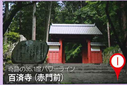
奇跡の35.1度パワーライン 百済寺(赤門前)