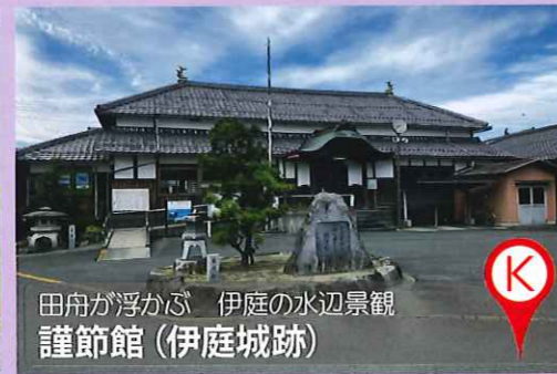
田舟が浮かぶ 伊庭の水辺景観 謹節館(伊庭城跡)