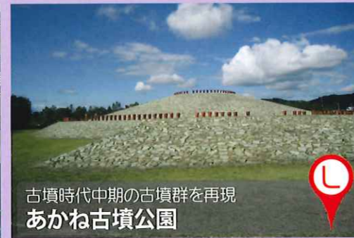
古墳時代中期の古墳群を再現 あかね古墳公園