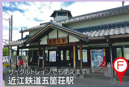
サイクルトレインでも使えます 近江鉄道五箇荘駅