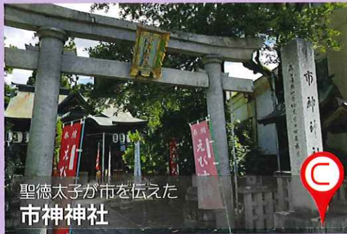
聖徳太子が市を伝えた 市神社