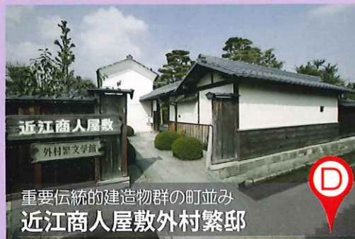
重要伝統的建造物群の町並み 近江商人屋敷外村繁邸