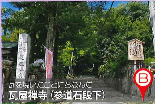
瓦を焼いたことにちなんだ 瓦屋禅寺(参道石段下)