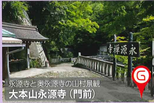
永源寺と奥永源寺の山村景観 大本山永源寺(門前)