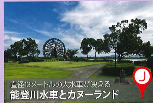
直径13メートルの大水車が映える 能登川水車とカヌーランド