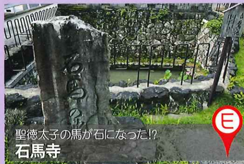
聖徳太子の馬が石になった!? 石馬寺