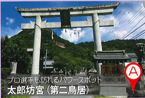
プロ選手も訪れるパワースポット 太郎坊宮(第二鳥居)