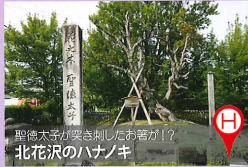
聖徳太子が突き刺したお箸が!? 北花沢のハナノキ