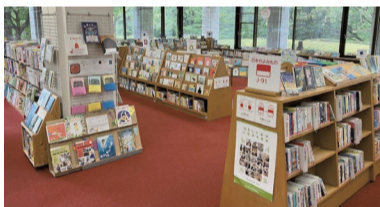
県立図書館の児童室

県立図書館の司書が市町立図書館を巡回して、各館の運営や課題などについて情報交換しています。各図書館は、この巡回で得た情報を図書館運営やサービスに生かしています。また、「人」のネットワーク充実につなげています。