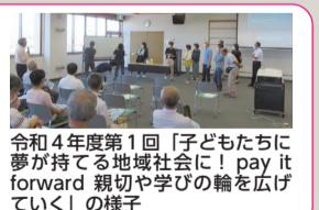
令和4年度第1回「子どもたちに夢が持てる地域社会に! pay it forward 親切や学びの輪を広げていく」の様子

野洲市では、生涯学習による「野洲の未来を担う次世代育成」を主な目的として、住民参加型の主体的な学習機会を提供しています。地域において活躍される方々を講師とし、楽しく学び、人づくりと活力ある地域づくりを目指しています。