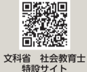
文科省 社会教育士特設サイト

また、地域で行われる様々な学びや活動の機会をコーディネートする「社会教育士」の魅力や活動の様子を発信しています。