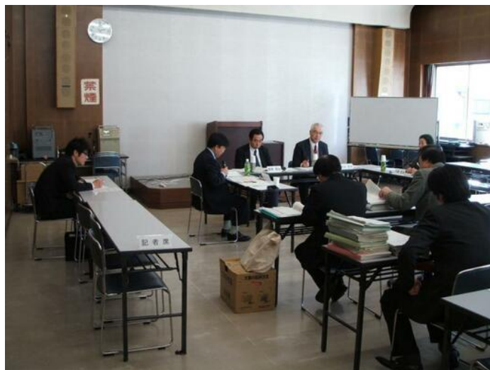
検証委員会の様子