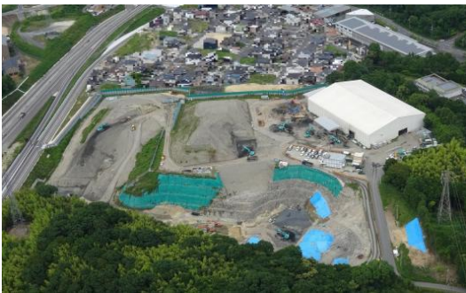
平成 30 年 (2018 年)