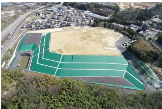
令和 3 年 (2021 年)