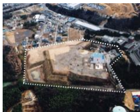
平成 18 年（2006 年）