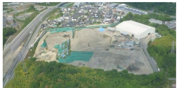
平成 29 年 (2017 年)