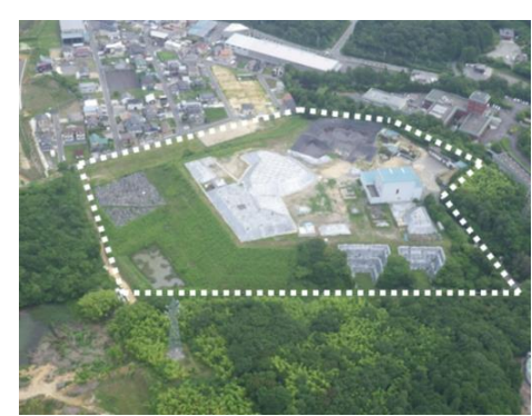
平成 25 年（2013 年）