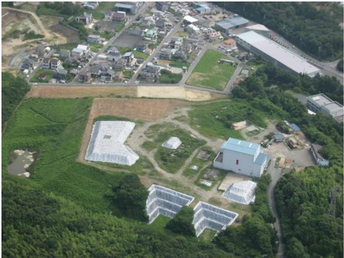
図1-2 処分場全景（平成22年航空写真）