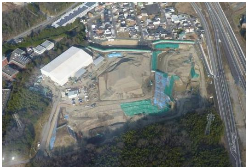
平成 28 年 (2016 年)