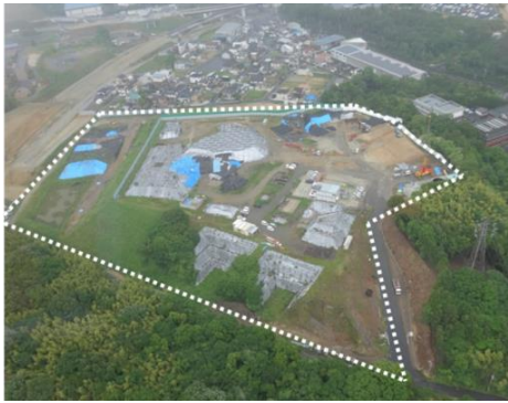
平成 26 年 (2014 年)