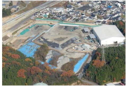
平成 27 年 (2015 年)