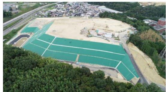
令和 2 年 (2020 年)