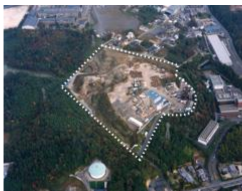
平成 12 年（2000 年）