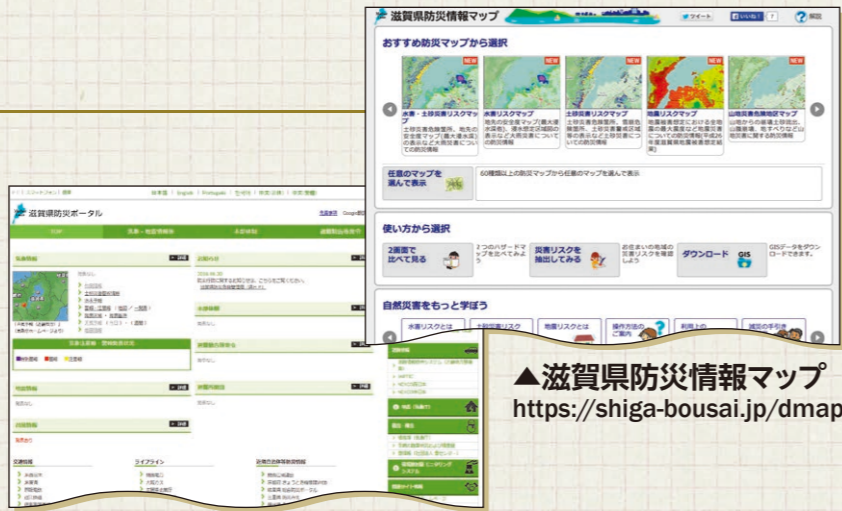
▲滋賀県防災情報マップ https://shiga-bousai.jp/dmap/