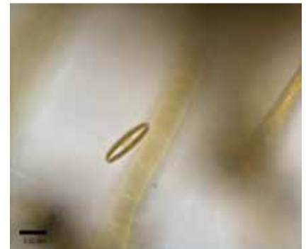
フナガタケイソウ