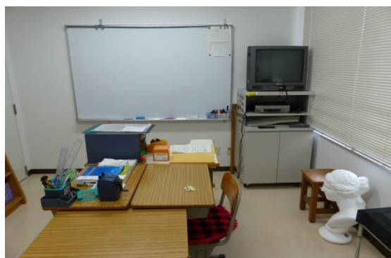
あすなろ学級教室内

教科担任制で、水口中学校の教師が時間割に合わせて授業を行っています。病気やけがの治療に専念しながら生徒たちは意欲的に教室に通ってきています。