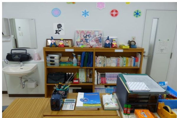
あすなろ学級教室内