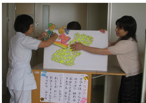
看護師も一緒にお楽しみ会