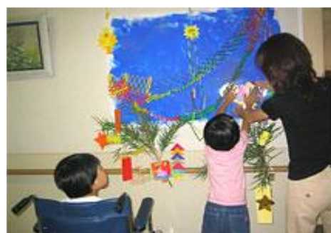
七夕かざりの様子