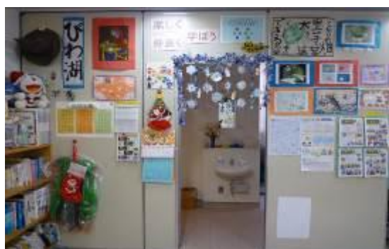
教室の中の掲示板 ～作品も見てね～