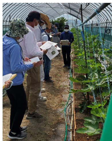
ハウス内での説明