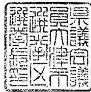
23ミリメートル平方