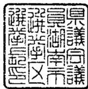
23ミリメートル平方