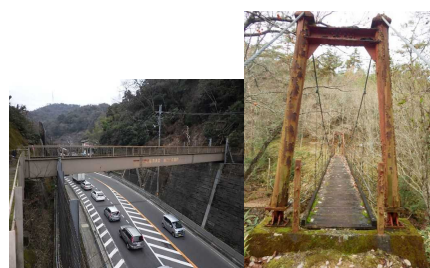
東海自然歩道 歩道橋