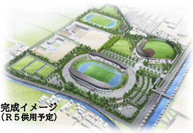
完成イメージ (R5供用予定)