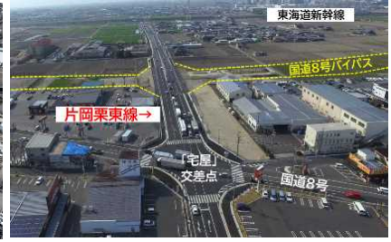
【都市の骨格を形成する 片岡栗東線】