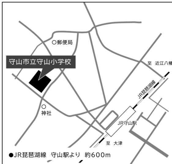
[守山市立守山小学校]