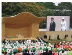
第70回あいち大会の式典

豊かな国土の基盤である森林・緑に対する国民的理解を深めるため開催する国土緑化運動の中心的行事です。滋賀県での開催は、47年ぶり2回目。天皇皇后両陛下をお迎えし、お手植えやお手播き、華やかなアトラクションなどを行います。