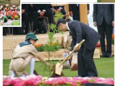
天皇陛下によるお手植え