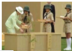
皇后陛下によるお手播き