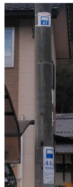
H30.3 まるまち看板設置