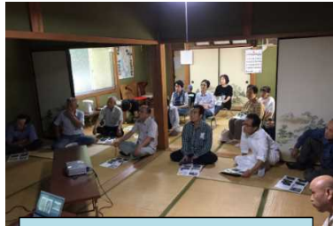
平成29年9月 出前講座