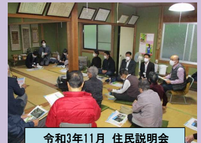
令和3年11月 住民説明会