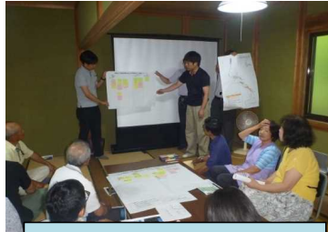
平成30年9月 図上訓練