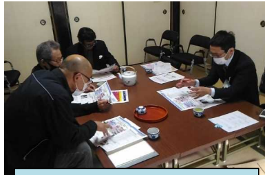
令和2年11月 机上避難訓練