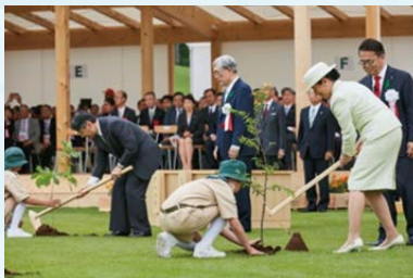
R1 愛知県大会の様子