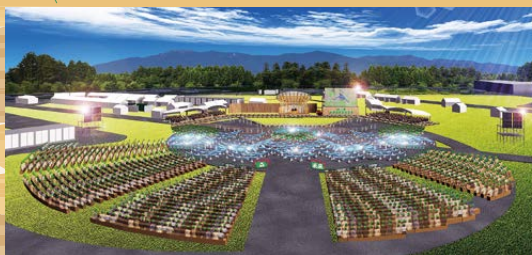
開催イメージ図（甲賀市「鹿深夢の森」）

豊かな国土の基盤である森林・緑に対する国民的理解を深めるために開催する国土緑化運動の中心的行事です。昭和25年（1950年）の第1回大会以来、例年春に各都道府県をまわり開催されており、滋賀県での開催は47年ぶりです。