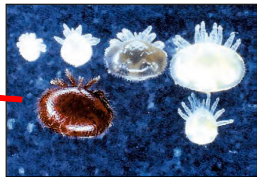
ミツバチヘギイタダニ