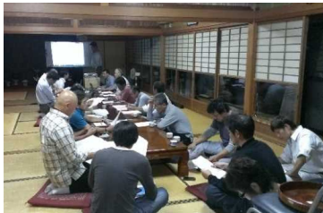
平成25年10月 避難について検討