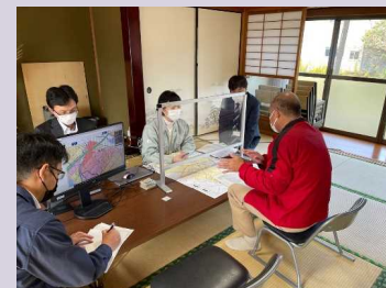
令和3年11月 個別説明窓口