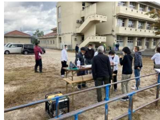
令和3年10月 避難訓練