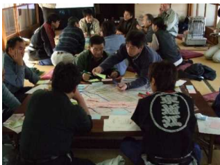
平成23年2月 図上訓練