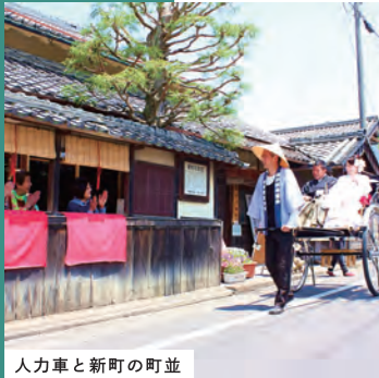
人力車と新町の町並