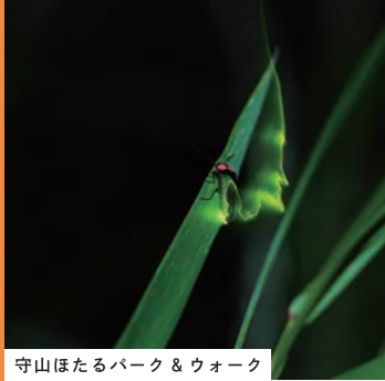
守山ほたるパーク&ウォーク