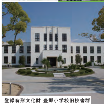
登録有形文化財 豊郷小学校旧校舎群