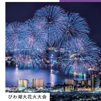
びわ湖大花火大会