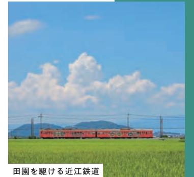
田園を駆ける近江鉄道