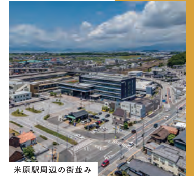
米原駅周辺の街並み