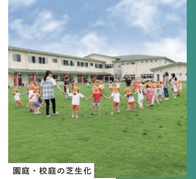
園庭・校庭の芝生化