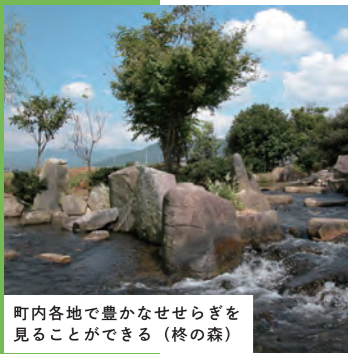
町内各地で豊かなせせらぎを見ることができる(終の森)