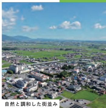
自然と調和した街並み