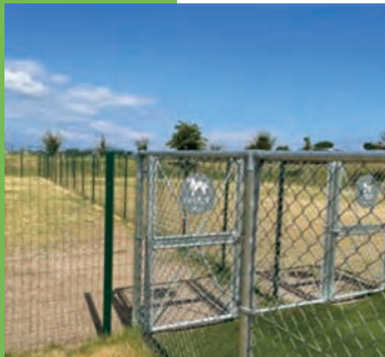
道の駅にあるドッグラン