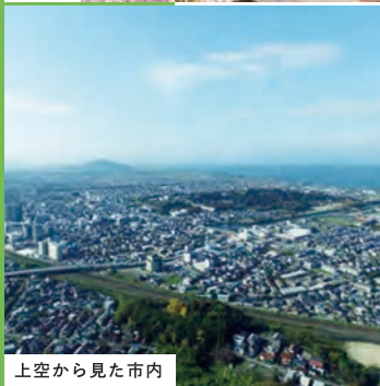
上空から見た市内