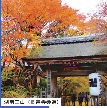
湖南三山（長寿寺参道）