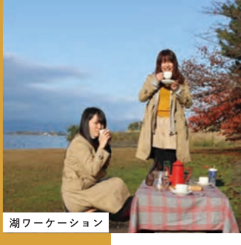
湖ワーケーション