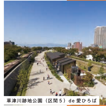
草津川跡地公園(区間5) de 愛ひろば