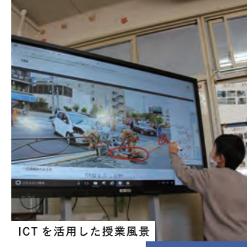
ICTを活用した授業風景