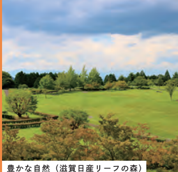
豊かな自然(滋賀日産リーフの森)