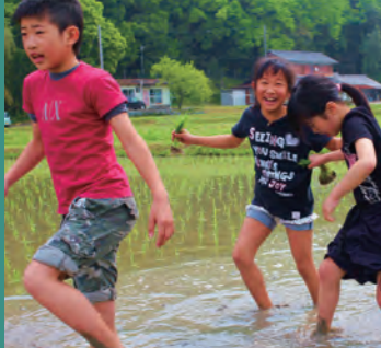
田植えをする子どもたち