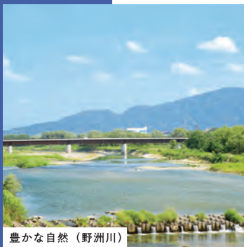
豊かな自然（野洲川）