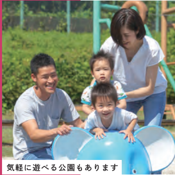
気軽に遊べる公園もあります