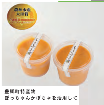
豊郷町特産物 ほっちゃんかぼちゃを活用して