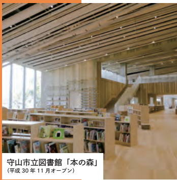
守山市立図書館「本の森」 (平成30年11月オープン)