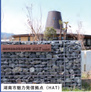
湖南省魅力発信拠点（HAT）