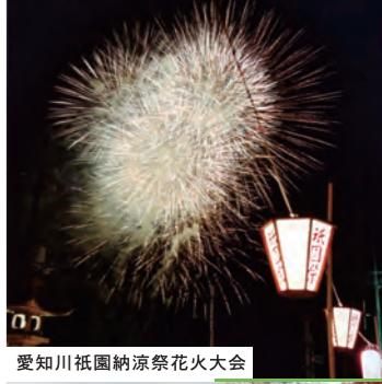
愛知川祇園納涼祭花火大会