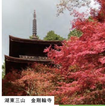
湖東三山 金剛輪寺