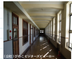
豊郷小学校旧校舎群

国指定の重要文化財（国宝含む）の指定件数は825件で、東京・ 京都・奈良に次いで全国4位。歴史と浪漫があちこちから漂っ てくる。 京都ではほとんど残っていない応仁の乱以前の建造物が数多く 現存していて歴男&歴女にはたまらない見るべき観光資源があ る。延暦寺、園城寺（三井寺）金堂や石山寺、宝厳寺唐門、国 宝彦根城など足を運んでみる価値のあるものばかりだ。