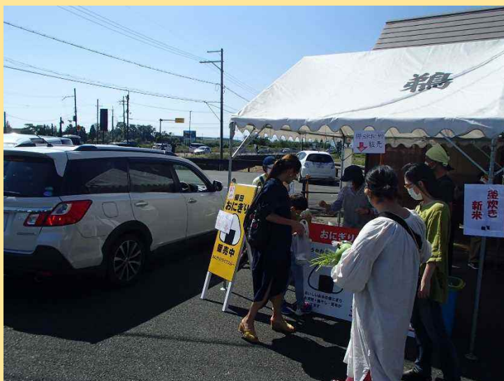
■棚田おにぎり販売の様子（ドライブスルー）