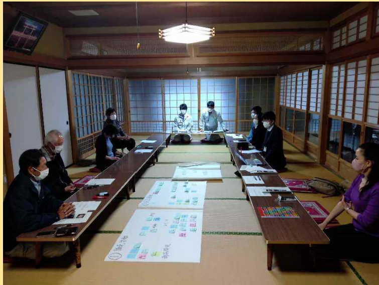
■ 次回活動の検討会議の様子