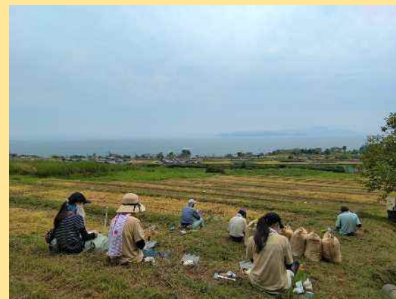
■ 棚田米おにぎりでお昼ご飯

令和3年9月12日、高島市鶴川で「パソナ農援隊（大阪市）」と「鶴川棚田保存会（高島市）」の協働活動が行われました。