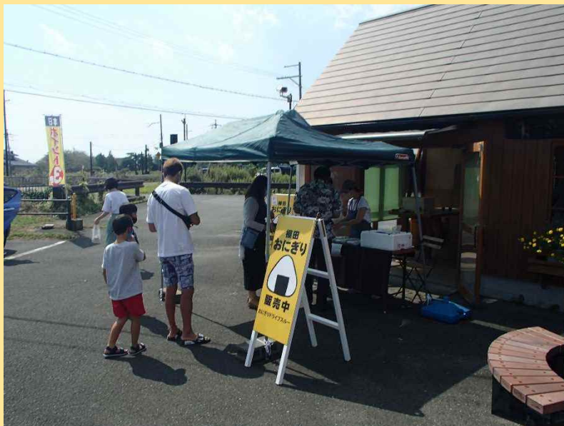
■ 棚田おにぎり販売の様子