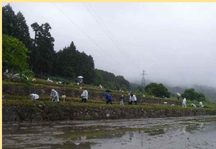
※5月23日に行われた田植えイベントの様子