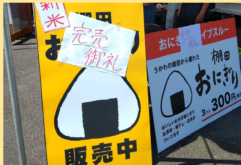
■11時40分ごろ、おにぎり約100パック完売しました。

令和3年10月3日、高島市鶴川で「パソナ農援隊（大阪市）」と「鶴川棚田保存会（高島市）」の協働活動が行われました。今回はいよいよ収穫祭本番、鶴川の自慢のお米でつくったおにぎりの販売です。パソナ農援隊に加え、収穫の際にも手伝いに来てくれていた立命館大学からも応援にきてくれました。