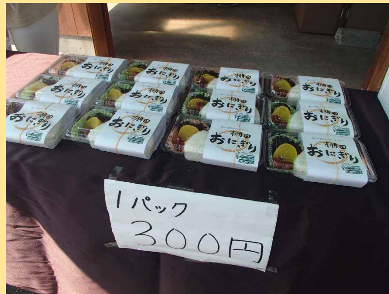
■ 棚田米おにぎりの販売（おにぎり3個入り1パック300円）

令和3年9月23日、高島市鵜川で「パソナ農援隊（大阪市）」と「鵜川棚田保存会（高島市）」の協働活動が行われました。両者は令和2年度に棚田地域の活性化等に関する協定を締結しています。