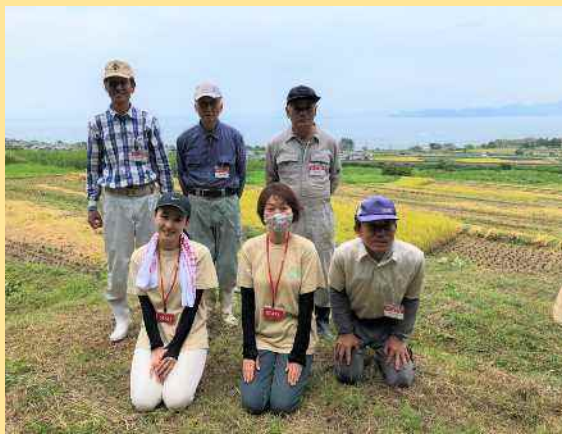
■ 棚田保存会とパソナ農援隊のみなさん