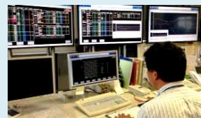
当庁施設を一括集中管理

デマンド監視装置にて使用電力量の見える化を行い、電力の使用を常時管理しています。