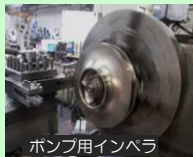
ポンプ用インペラ

ポンプ用インペラ(羽根車)を切削加工して、ポンプ揚程を低減します。これによりポンプの余分な消費動力を削減します。(H24/25年度 吉川浄水場)