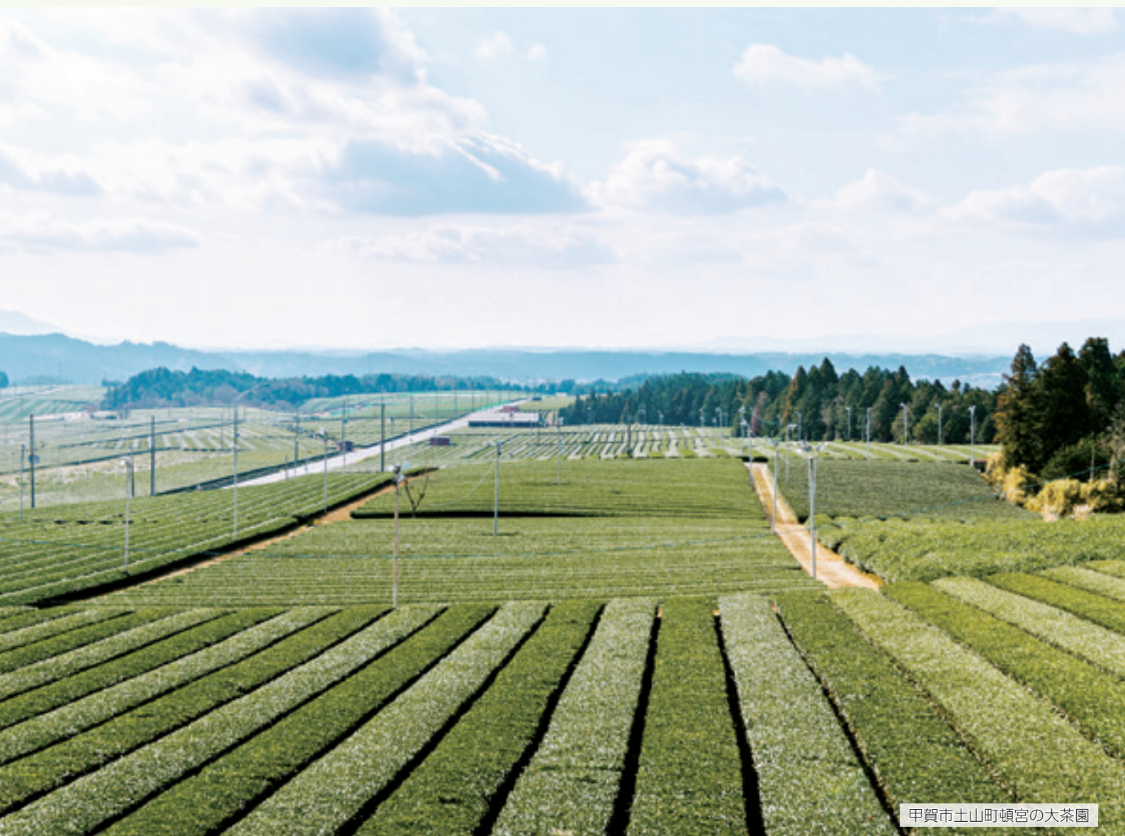
甲賀市土山町頓宮の大茶園