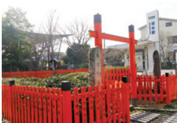
日本茶発祥の地と伝わる日吉茶園（大津市）

滋賀県のお茶の歴史は古く、平安時代初期の西暦805年に伝教大師最澄が唐の国から茶の種子を持ち帰り、比叡山の山麓に播いたことが始まりとされています。比叡山の麓にある日吉大社には、その時のものと伝わる茶園があり、日本茶発祥の地といわれています。このように、本県では長い歴史を経て茶栽培の技術が脈々と受け継がれています。