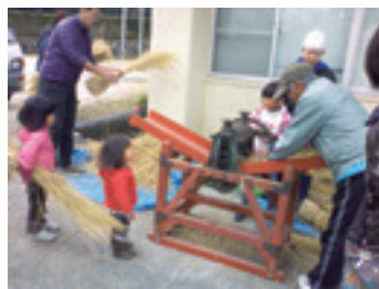
もはや恒例行事!?! のしめなわづくり

2015年11月29日、昨年に続き2回目となるしめなわづくりを大津市八屋戸の守山公民館で実施しました。農薬・化学肥料を使わず栽培したもち米のわらを使い、16名が稲作にまつわる文化を体験しました。1月20日、作って食べるシリーズ3回目の料理講習を実施。大雪の中18名が参加しました。メニューは野菜の具だくさんポトフ、スパゲティのサラダ、みずかみのご飯、漬物、デザートなど。2月は味噌づくり、3月に大津農業祭への参加を予定しております。