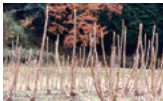
冬場の「タラノキ畑」

永源寺地域では、山が近いこともありタラの芽を古くから利用してきました。近年、品種改良が進み、タラノキをビニルハウスなどで温め、1月から3月にかけてひと足早い春の食材として利用する「ふかし栽培」ができるようになりました。