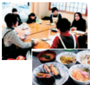
「おにぎらず」で米の消費促進！

小学校の食育にも出向き、子ども達が育てたお米でおにぎらずに挑戦してもらい、大変好評でした。無農薬の大豆も生産者からわけてもらい、手造りみそを作ったり、大豆レシピを考えて和風にしたり洋風にしたり、いろいろチャレンジしています。これからも、より安全な米・野菜がつくられ、いつまでも健康でいられるようにしたいものです。