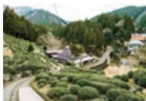
まんどころ政所（東近江市永源寺）

滋賀県は、全国的には小さな茶産地ですが、お茶を知る人にとっては、実は魅力的な産地がいくつもあります。昼夜の寒暖差が大きい山間地でじっくりと育ち、香り高い銘茶の産地として知られる朝宮（甲賀市信楽町）、なだらかな丘陵地に茶畑がひろがり、まったりとした深い味わいが持ち味の土山（甲賀市土山町）、「宇治は茶所、茶は政所」と謳われ、現在その生産量は非常に少ないものの古来より銘茶の産地として知られる政所（東近江市永源寺）、綿向山に抱かれた大自然で育った、しっかりとした深みのある味が特長の北山（蒲生郡日野町）など、小規模ながらも産地の特徴を生かしたお茶作りが、それぞれの産地で行われています。