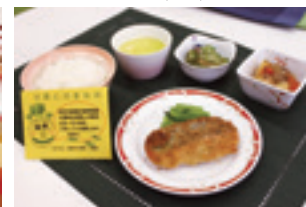
農林水産大臣賞受賞メニュー

初夏にはアスパラガスやきゅうり、トマトなど、秋は彦根梨、冬は大根、白菜、ほうれん草、菜の花など、多種の野菜を使用しています。