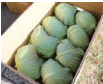
「近江のキャベツ」として地元量販店へ