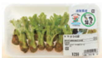
環境こだわり農産物の認証を受けた永源寺のタラの芽

芽を覚ますには、化学合成農薬である植物ホルモンは欠かすことができません。そこで、それ以外の除草剤などの化学合成農薬を減らすために、ビニルマルチによる抑草、微生物によるカビ予防などの技術を指導しました。また、化学肥料を減らすため、地域で廃棄されていたソバ殻を有機質肥料として利用し、くん炭としてタラノキ畑に投入することなどを指導してきました。