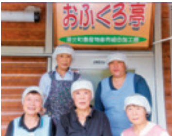
作り手は、私達です