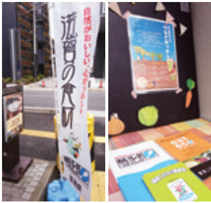
のぼりやパンフレットで地産地消をPRしています

わない方法で野菜を栽培していて、その半数以上が県の、環境こだわり農産物の認証を受けています。認証を積極的に受けることで、少しでも制度のことをPRできたらと考えています。