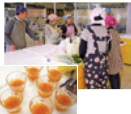
「農」と「食」について楽しく学んでいます