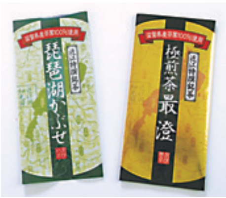
解禁日は9月15日 「極煎茶 最澄」と「琵琶湖かぶせ」

て、「 まわみせんちやさいちよ 極煎茶最澄」を商品化しました。日本で最初に茶を伝えたと言われる伝教大師・最澄の名称を賜り、煎茶の最高級品として県内外の消費者に広く愛されるよう命名されました。