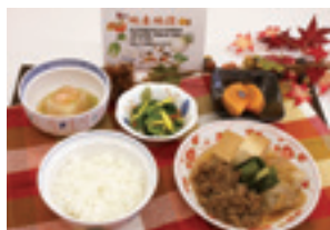
秋の地産地消メニュー

また年4回、すべての料理に地元の食材を使用した料理を提供する「地産地消イベント食」を実施しています。患者さんにも大変好評で、食事のアンケートでは70%以上の方が美味しいと答えてくださっています。