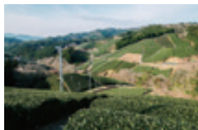
あさみや朝宮（甲賀市信楽町）