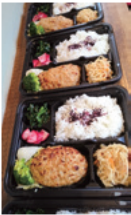
近江野菜たっぷりのお弁当

これからはもっと多くの方と連携して滋賀県の農業、人、まちが元気になる事業を展開していきたいと考えています。