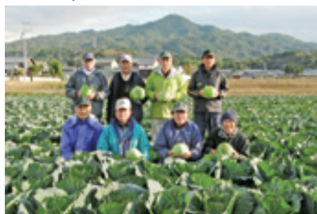
湖南アルプスを望むほ場にて

的な取組が開始されたことから、今後の作付面積の拡大を見据えて、これに参画しました。