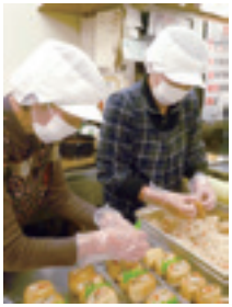
愛情込めて作っています

た。お客様の声に耳を傾け、試行錯誤を繰り返しながら努力した甲斐あって、今日ではリピーターも増え、直売所の看板商品にまで成長しました。「戦国いなり」用に、1日1俵(60kg)もご飯炊きをしたこともあります。