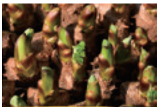
出荷を待つ永源寺のタラの芽