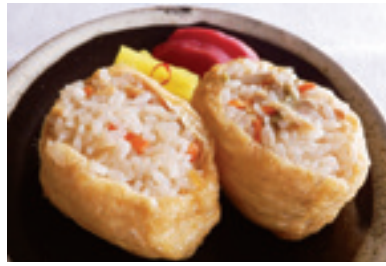
看板商品「戦国いなり」

今では、ご飯ものや惣菜、漬物、餅など、季節限定商品も含めて55種類の加工を行っています。なかでも、人気No.1商品は「戦国いなり」です。