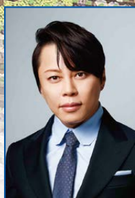
西川貴教 さん 滋賀ふるさと観光大使