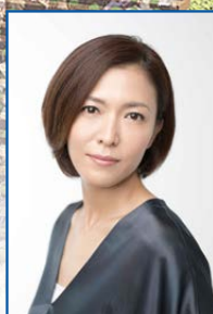
安蘭けい さん 元宝塚歌劇団トップスター

天皇皇后両陛下をお迎えし、 会場では厳かな式典、 華やかなアトラクションが 繰り広げられます。