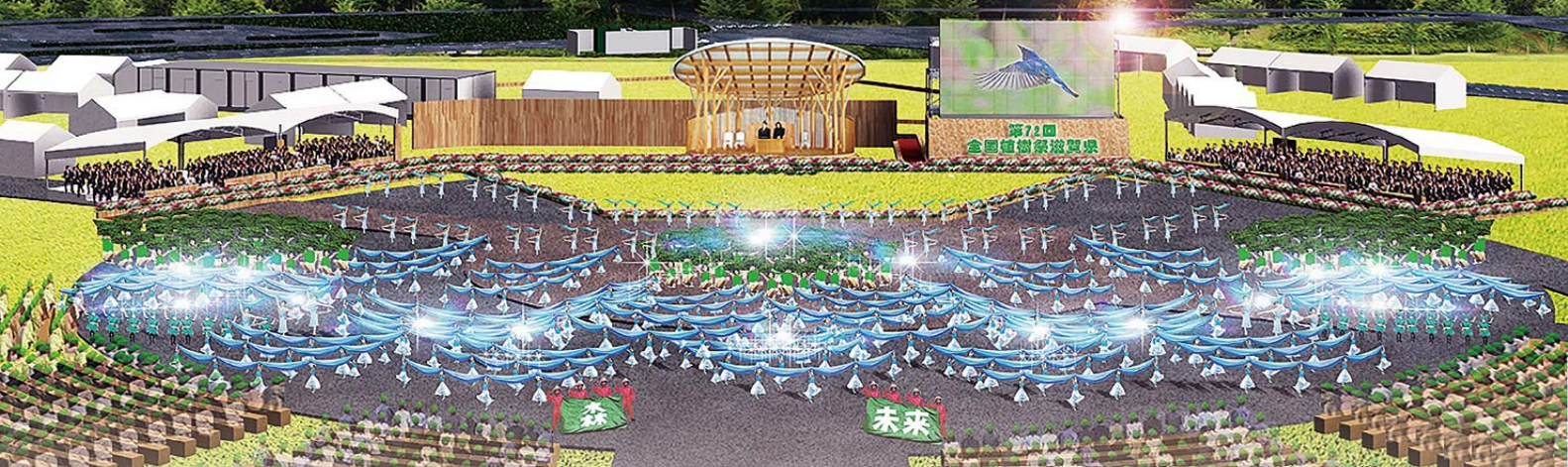
会場のイメージ図