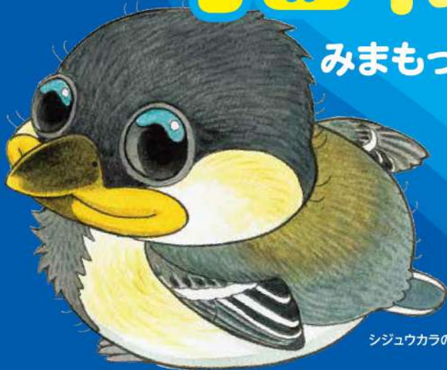
シジウカラのヒナ