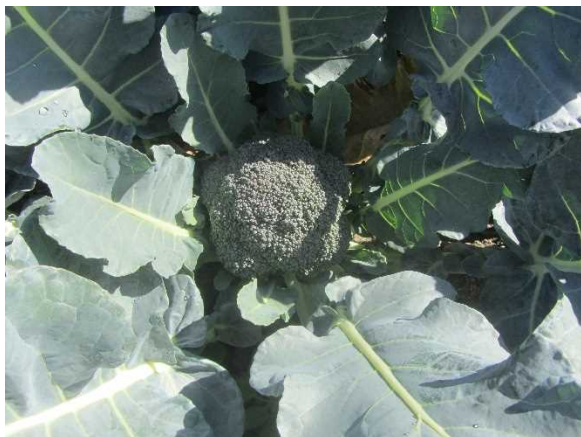
収穫間近のブロッコリー

これから本格的な出荷時期を迎えますが、今後も現地巡回や情報提供を行い、確実な収穫とお荷につながるよう活動を行います。