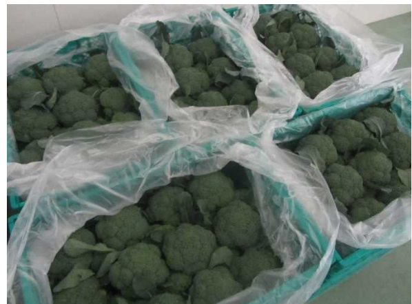
卸売市場にお荷されるブロッコリー