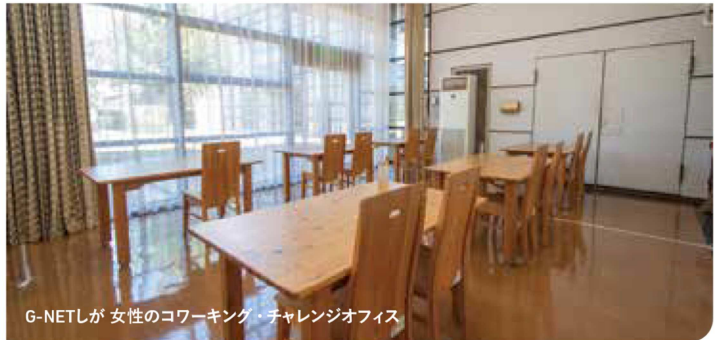
G-NETしが女性のコワーキング・チャレンジオフィス