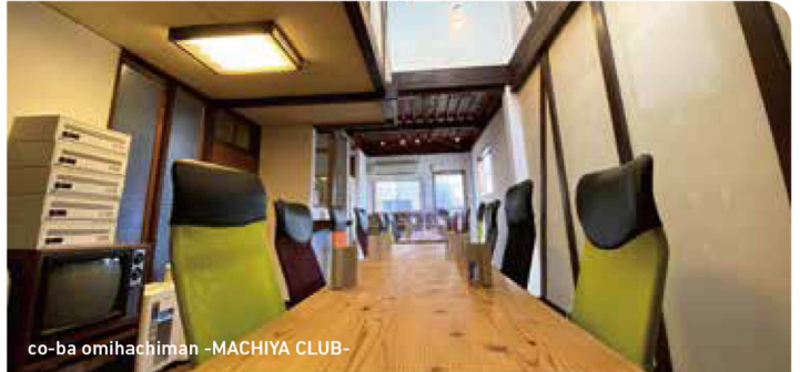
co-ba omihachiman -MACHIYA CLUB-