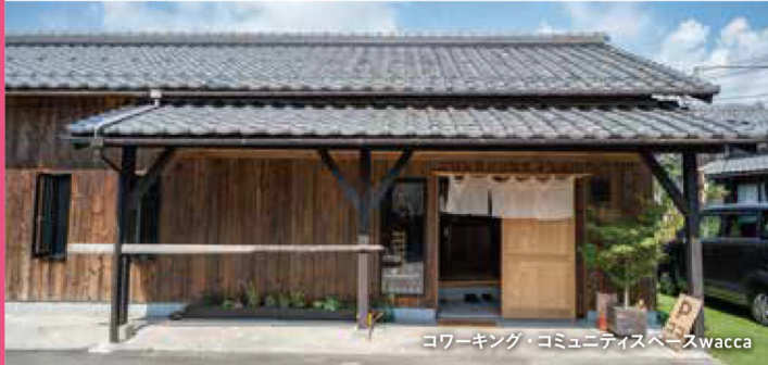
コワーキング・コミュニティスペースwacca

事務所を構えるにはハードルが高いけれど、ちょっとした作業スペースならすぐに実現できる。思い立ったら気軽に利用できる「コワーキングスペース」は、新しい働き方のスタイルとして注目されています！