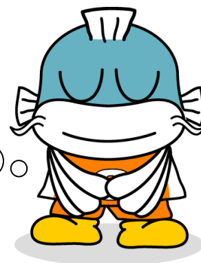
滋賀県の イメージキャラクター キャッピー