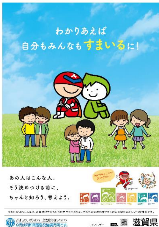
※1 令和3年度 同和問題啓発強調月間ポスター