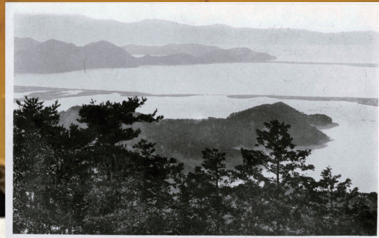
古写真 (old photo)