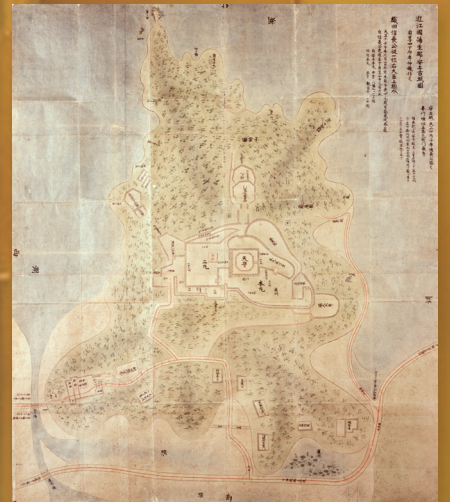
古絵図 (old illustration)