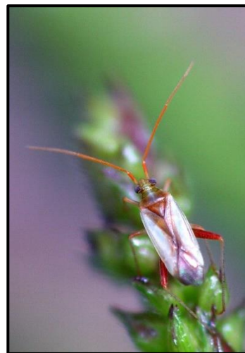
アカスジカスミカメ