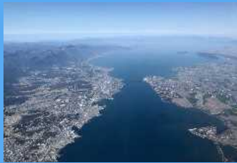
【行政・団体・県民等】