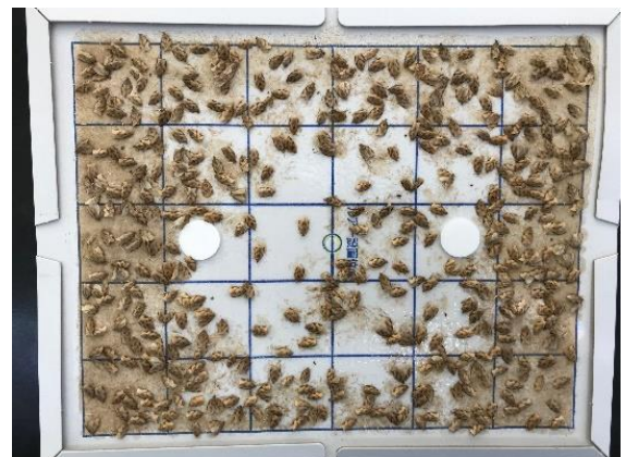
図 フェロモントラップによるチャノコカクモンハマキ成虫誘殺数の推移(甲賀市水口町)