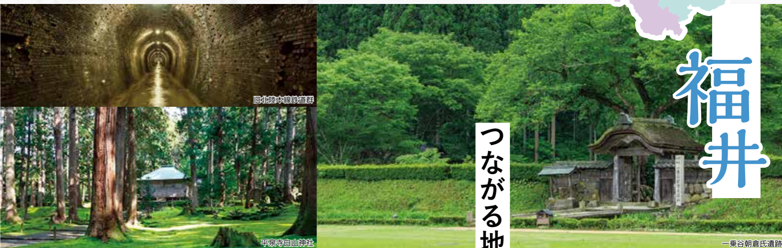
旧北陸本線鉄道跡